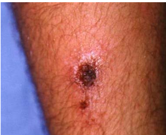
Figure 5 : lésions ulcéro-croûteuse et diffusion intra dermique, MP 37.