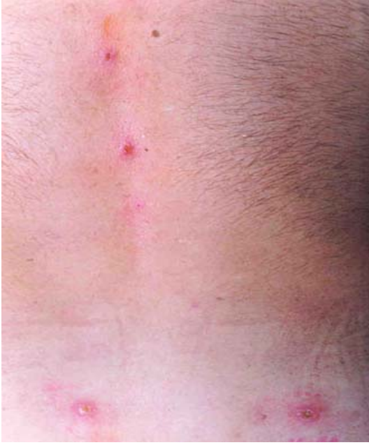
Figure 6 : lésions métastatiques en zones de frottement, ceinture et épineuses, stage AMF.