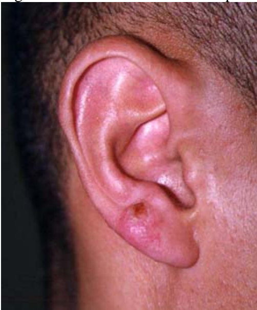
Figure 4 : lésion croûteuse de l'oreille, stage AMF.