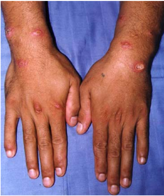
Figure 3 : lésions ulcéreuses multiples des poignets, stage AMF.